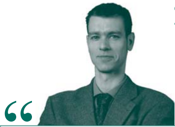
Rainer Heidorn - Recht der Erneuerbaren Energien in Deutschland, Vertragsrecht, Einspeiserecht, Öffentliches Baurecht

ebenfalls gegen den Grundstückseigentümer vorgehen. Gemäß § 585 BGB hat der Verpächter dem Pächter den vertraglichen Gebrauch zu gewähren und diesen auch während des bestehenden Pachtverhältnisses zu erhalten. Der Pächter kann daher ein Vorgehen des Verpächters gegen den Dritten verlangen und darf im Zweifelsfall nicht darauf verwiesen werden, die Pachtzahlungen zu mindern und die Errichtung der WEA zu dulden.